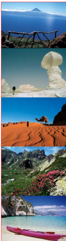
Camp de base

Hameau de la Combe 30 440 Saint Laurent-le- Minier